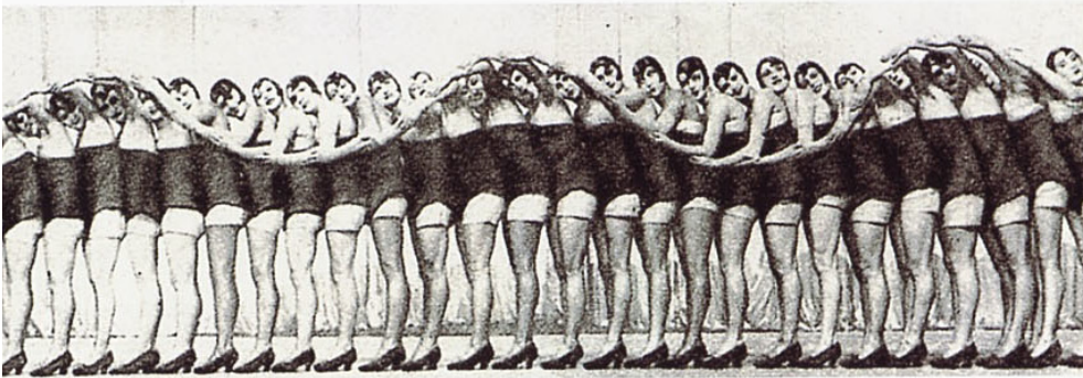
Girlriege in Moskau, um 1920

Innerhalb der Masse herrscht Gleichheit ... Ein Kopf ist ein Kopf, ein Arm ist ein Arm, auf Unterschiede zwischen ihnen kommt es nicht an. Um dieser Gleichheit willen wird man zur Masse. Elias Canetti