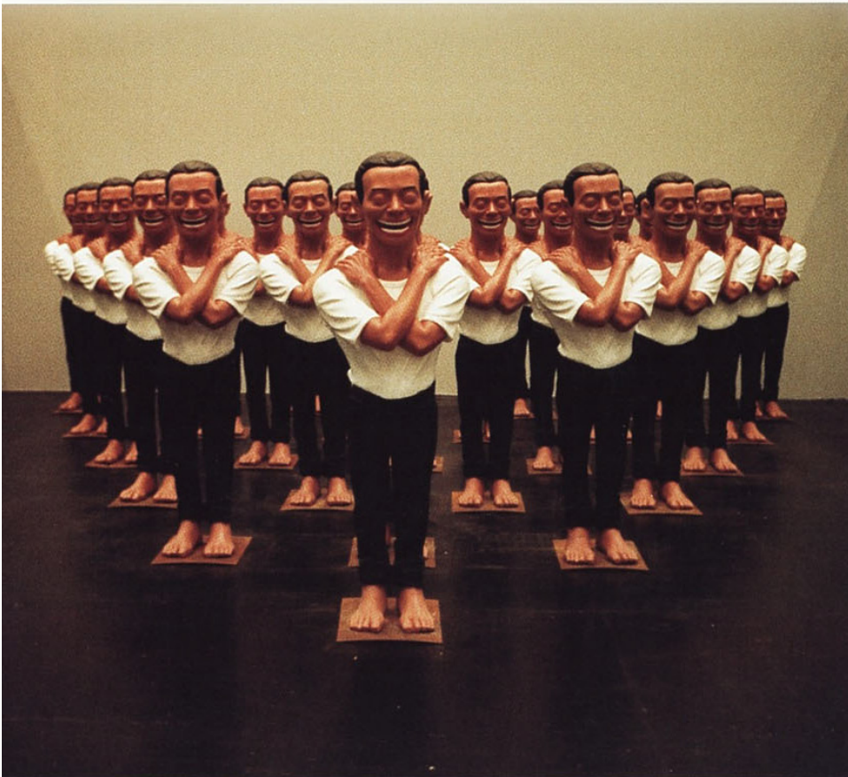
125 YUE MINJUN Gong Yuan 2000, III, 2000 Polyester, Acryl, H je 200 cm

Dem Phänomen des Massenornaments begegnen wir in den 25 lachenden Gesichtern menschengrosser Skulpturen mit verschränkten Armen, gekleidet in Jeans und amerikanische T-Shirts, die Köpfe einheitlich mit streng gescheiteltem künstlichem schwarzem Haar bedeckt. So präsentiert sich heute der chinesische Künstler Yue Minjun mit seiner Arbeit (Kat. 125). Seine Figuren sind strikt angeordnet und haben doch einen Touch von Individualität. Das liegt an dem eigenartigen Gesichtsausdruck und einem penetranten, fast fratzentartigen Lachen. Einem Lachen, das befremdend wirkt und erschreckt: in Polyester erstarrt ist der grosse Mund, aus dem provokant alle 32 Zähne blecken. Verweist der Künstler damit auf die verschiedenen Bedeutungen des Lachens im interkulturellen Diskurs?