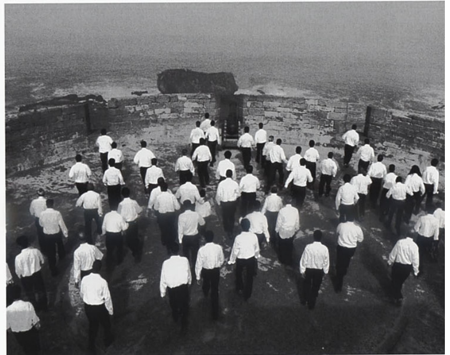
149 SHIRIN NESHAT Rapture, 1999 Standbilder Barbara Gladstone Gallery, New York

Im Zusammenhang mit einem solchen digitalen Phänomen fasziniert auch die Präzision, mit der die paradoxe Situation des zeitgenössischen Internet-Users eingefangen wird. Physisch sitzt er wie ein Autist vor seinem Bildschirm, während er zugleich mit der ganzen Welt »connected« ist. Von aussen betrachtet, gleicht diese neue Netzgeografie, diese allgegenwärtige Kollektivität der vernetzten Globalbürger, einem neuen »digitalen Ornament der Masse«. Die Gemeinschaft, die sich daraus ergibt, organisiert sich nicht mehr »sozial«, sondern »ornament-all«. Die herkömmlichen Kategorien von Raum und Zeit, Ort und Identität, Heimat und Fremde greifen nicht mehr. Kein Wort wird indessen in dieser Cybergesellschaft öfter benutzt als der Begriff »home«. Das Sich-häuslich-Einrichten scheint die letzte Sehnsucht des Individuums in einem immateriellen Pluriversum (Peter Weibel) aus Information und Kommunikation zu sein. In der »home-page«, mit der man über-all und dadurch nirgends zuhause ist, verdichtet sich dieses Verlangen.