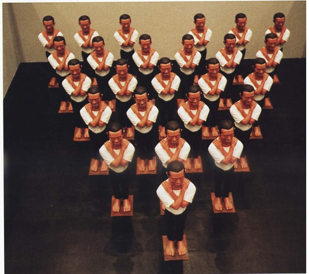
125 YUE MINJUN Gong Yuan 2000, III, 2000 Polyester, Acryl, H je 200 cm

Zhuang Hui bedient sich für seine Gruppenbilder der alten Panoramakamera seines Vaters. Bei genauerer Betrachtung werden hier die traditionellen Hierarchien in einer sehr subtilen Form gestört. Der Künstler selbst – symbolisch für den subjektiven Anachronismus – sitzt im Gruppenbild auf der rechten Seite. Der Zerfall aller alten, traditionellen Werte wird angedeutet. Wie soll sich das alte China heute nach der Kulturrevolution zwischen Konsumgier und Internetverboten behaupten? Wie werden die heutigen Hierarchien definiert, und wie schnell kann ein Zeichen seine Bedeutung verlieren und neu aufgeladen werden? VF